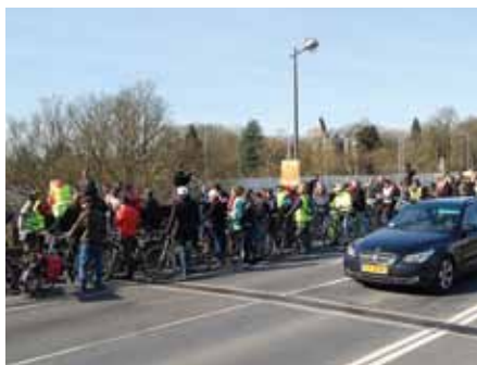
Manifestation cycliste «Place au vélo» sur le Pont Adolphe, 24 février 2014

Autre dossier majeur, déjà entamé sous le ministre précédent, fût l'actualisation de la loi relative au réseau cyclable national [...], finalement entrée en vigueur le 28 avril 2015. Tandis que la loi précédente, datant de 1999, était principalement axée sur les itinéraires touristiques, le nouveau texte tient mieux compte du vélo en tant que moyen de déplacement au quotidien et permet une planification moins rigide des itinéraires