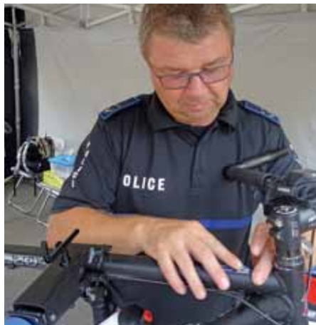
La Police Lëtzebuerg offre son service de codage de vélos également lors de manifestations telles «Alles op de Vëlo am Mamerdall».

Pour obtenir un rendez-vous pour le codage de votre vélo, il suffit d'envoyer un e-mail à l'adresse suivante: