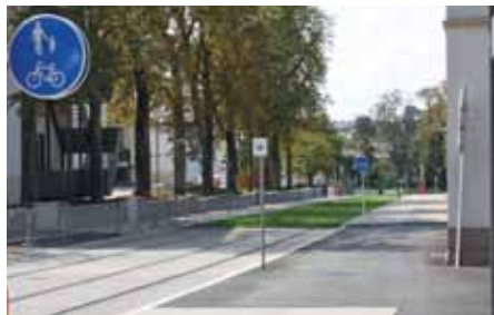
Allée Scheffer, Limpertsberg

Bonnes nouvelles pour les cyclistes dans la capitale: après l'ouverture du second tronçon de tramway, la piste cyclable venant du Kirchberg continue désormais le long de l'Allée Scheffer et jusqu'à la Place de l'Étoile.