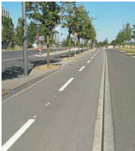
Nei Vëlospist op der Südsäit vun der Avenue J. F. Kennedy (Kierchbiërg)