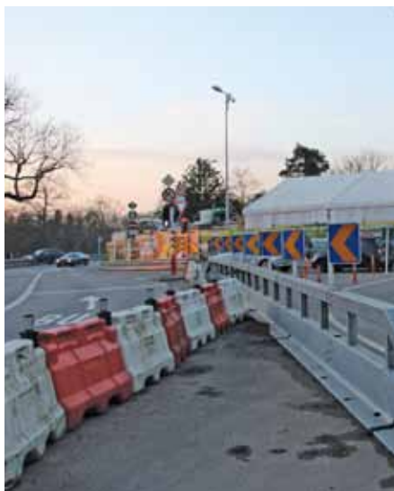
Pont Adolphe - Platz für Radfahrer!