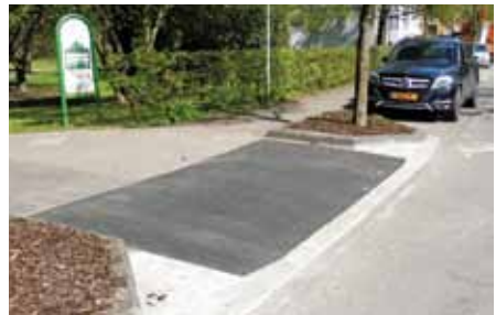
Rue de Stavelot