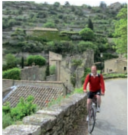
Aufstieg nach Gordes

Von Goult aus machten wir einen Tagesausflug über Roussillon nach Gordes. Wer als