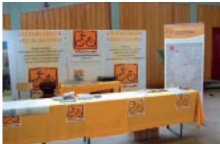
Dimanche, 4 avril 2011: stand d'information à Differdange au Festival du Vélo