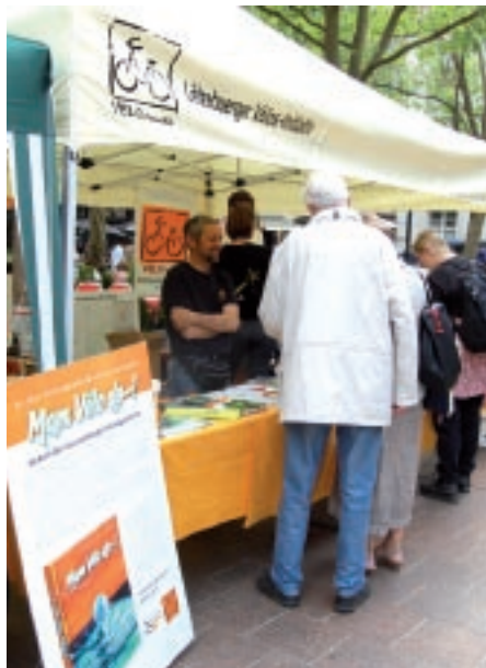
Les gens se sont renseignés auprès de notre stand d'information lors de la fête du vélo