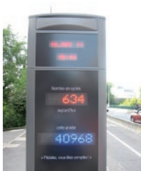
Die Zählsäule auf der Passerell am 02.03.2011 sowie am 18.05.2011