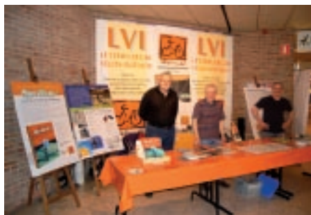
Samedi, 3 avril 2011: stand d'information à la Belle-Etoile

La LVI est présente de plus en plus souvent dans le pays avec des stands d'information. Nous avons participé au Festival du Vélo à Differdange.