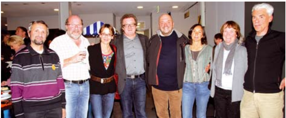
En Deel vun de Grënnungsmembere vun der LVI