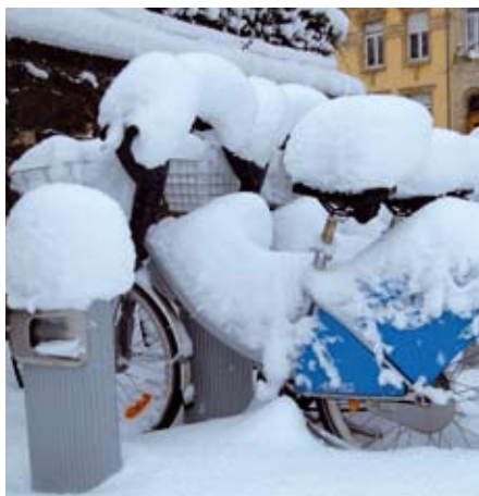
Wanter zu Lëtzebuerg