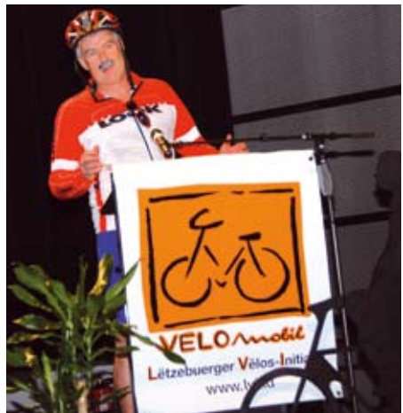
Ministère bei der LVI, där richteger an där a Sportstenuer